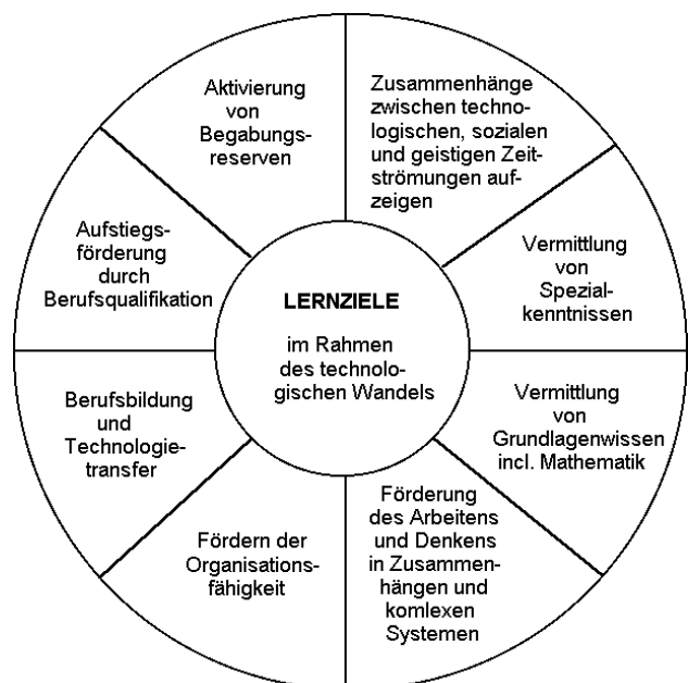
Abbildung 2: Der Nutzen des lebenslangen Lernens.

Bildung befaßt sich mit der Creation von Worten – Begriffen – Gedanken – Lehrinhalten und Theorien. Durch sie wird unser Handeln nicht unerheblich bestimmt. Das dafür nötige Geld wird man den Politikern schon abringen können, soweit es die staatlichen Einrichtungen betrifft. Der einzelne Bürger muß sich auch selbst engagieren.